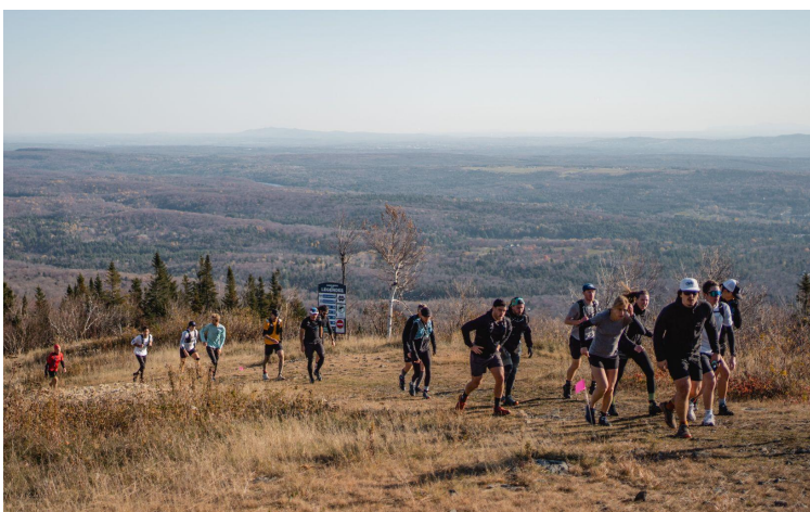
Coupe Giroux 3,7 km