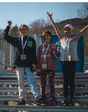
Mini Coupe 800 mètres

Nous offrons trois distances lors de l'événement : la Coupe des 3 sommets, la Coupe Giroux et la Mini Coupe (celles-ci peuvent varier entre l'édition hivernale et estivale). Nous proposons aux partenaires intéressés de s'associer à l'une des trois distances et ainsi bénéficier d'une visibilité lorsque les communications sont dirigées en fonction de ces distances.