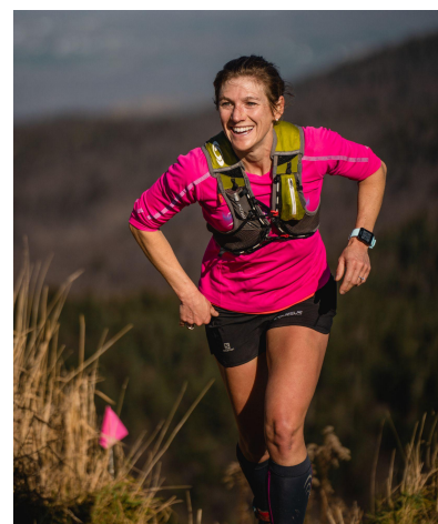
Coupe des 3 Sommets 12,5 km